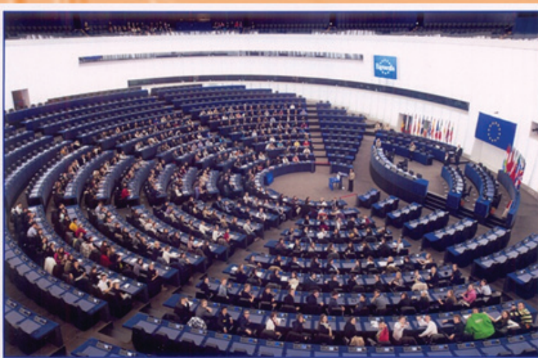
EUROSCOLA DU 26 JANVIER 2012

likumsakarīga bija viņu pašu spēkiem noorganizētā dalība projektā „Eiropas vēlēšanas”. Māka sadarboties komandā, filmēšanas prasmes, dokumentācijas pareiza noformēšana, svešvalodas zināšanas deva cerētos rezultātus. Tika laimēts brauciens uz Strasbūras Eiroparlamentu!