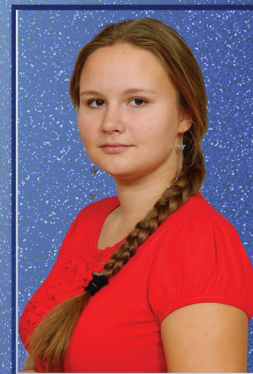
Учебный центр Полина Полейко