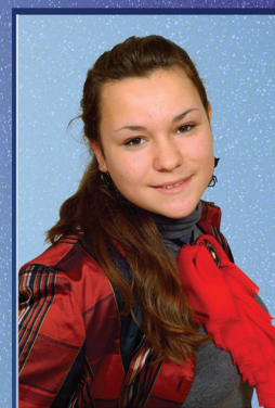
Вице президент Диана Анча