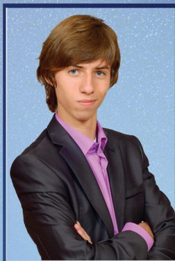
Президент Максим Гесин