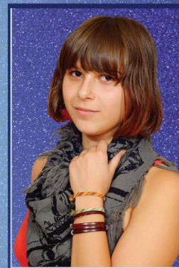
Центр сотрудничества со школьным музеем Оксана Семко