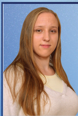
Центр культуры Рита Новикова