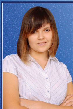
Центр сотрудничества с основной школой Диана Румянцева