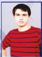
Учебный центр Андрей Курятников