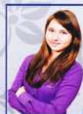
Учебный центр Ольга Ситинская