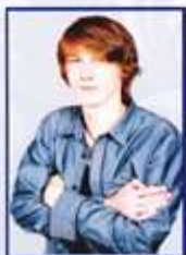
Вице-президент Игорь Урбан