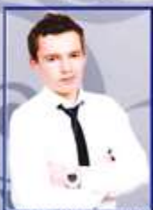
Центр культуры Амгон Осадчий