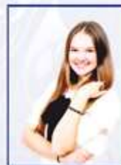
Учебный центр Карина Пивоварова