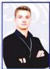
Президент Илья Лейко