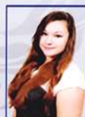
Центр культуры Диана Анча