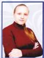
Skolēnu pašpārvalde 2012./2013. m.g.